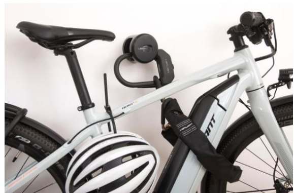
Hiplok ANKR | UVP: 89,99 Euro

Fahrradschlösser sind gut, doch fest in der Wand verankerte Fixpunkte in Verbindung mit einem Fahrradschloss sind besser. Egal ob für Büros oder den Privatgebrauch, der Hiplok ANKR ist die clevere Lösung für zusätzliche Fahrradsicherheit, wo sie benötigt wird. Mit seinem zweiteiligen Zylinderkörper aus gehärtetem Edelstahl und dem mitgelieferten Befestigungsmaterial erfüllt der Hiplok ANKR die hohen Sicherheitsanforderungen der Sold Secure-Gold-Zertifizierung. Perfekt kombinieren lässt sich das Tool mit den Bügel- oder Kettenschlössern von Hiplok.