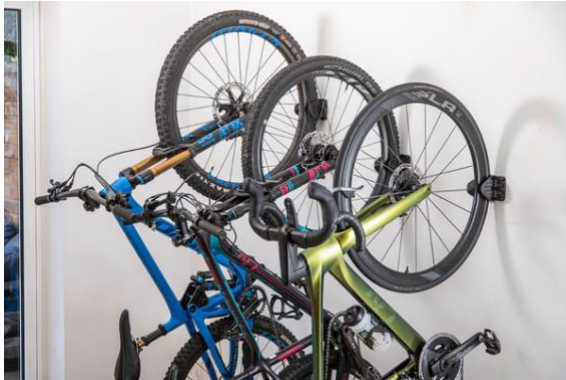
Hiplok JAW | UVP: 19,99 Euro

Das Hiplok JAW kann mit dem Kabelbinderschloss Hiplok Z LOK und Hiplok Z LOK COMBO kombiniert und damit um eine Wegfahrsperrung ergänzt werden.