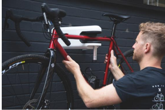
Hiplok AIRLOK | UVP: 189,99 Euro

erste Fahrrad-Wandhalterung mit Sold-Secure-Diamant-Zertifizierung – keine andere Halterung verspricht mehr Schutz. Damit Diebe keine Chance haben, kommt ein Rahmen aus gehärtetem Stahl sowie ein 30 Millimeter starker, abschließbarer