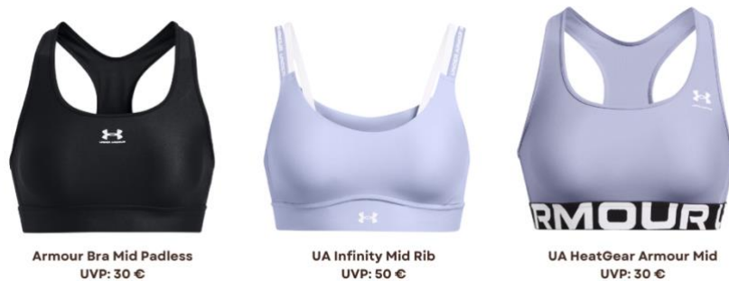
Armour Bra Mid Padless UVP: 30 €

Weitere UA Sport-Bras in dieser Kategorie: