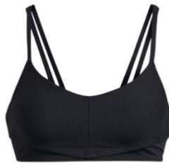
UA Meridian Bralette UVP: 60 €