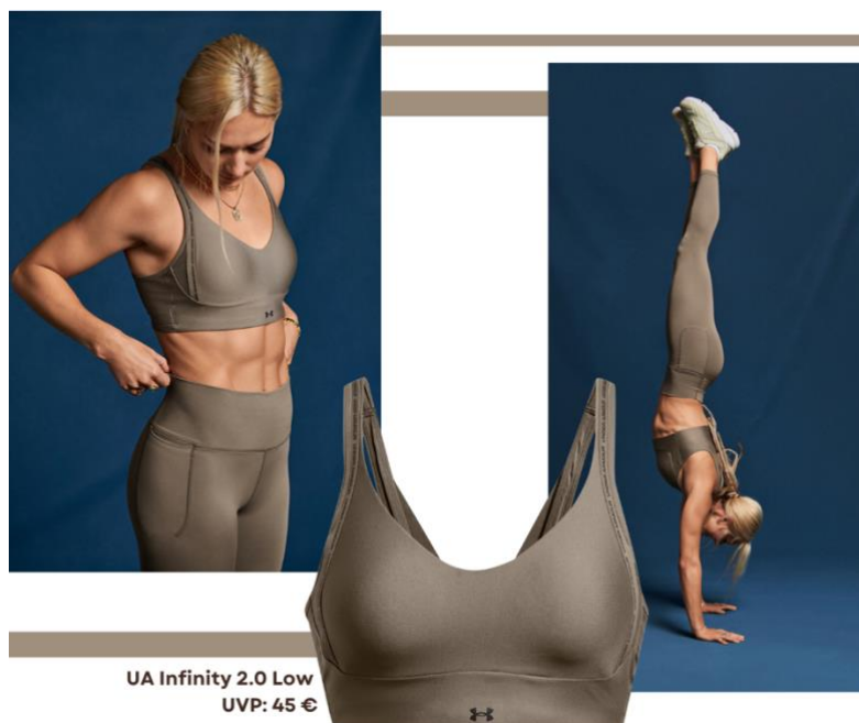
UA Infinity 2.0 Low UVP: 45 €

Gerade am Anfang des weiblichen Zyklus empfiehlt es sich für Frauen, Sportarten mit vergleichsweise geringer Belastung wie Yoga, Pilates oder leichtes Krafttraining in den Trainingsplan zu integrieren. Für diese Aktivitäten und im aktiven Alltag ist ein UA-Sport-Bra mit low impact die ideale Wahl.