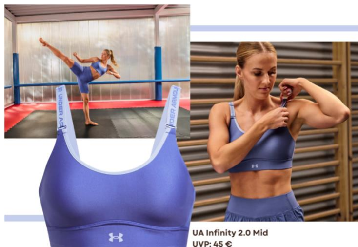
UA Infinity 2.0 Mid UVP: 45 €

Noch nie war die nächste Rennradtour oder der Zumba-Kurs so bequem wie nach der Wahl des richtigen Sport-Bras: Mid Impact lautet die Devise bei Sportarten mit mittlerer Intensität. Die BHs von Under Armour bieten genau den richtigen Halt, um das Brustgewebe zu stützen und gleichzeitig Komfort und Bewegungsfreiheit zu gewährleisten.