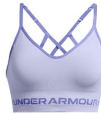
UA Seamless Low Long UVP: 40 €