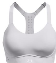
UA Uplift High UVP: 70 €