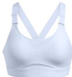
UA Infinity High UVP: 60 €