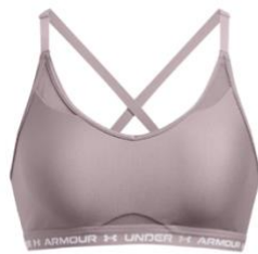
UA Crossback Low UVP: 30 €

Weitere UA Sport-Bras in dieser Kategorie: