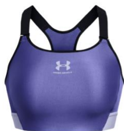
UA HeatGear Armour High UVP: 45 €

Weitere UA Sport-Bras in dieser Kategorie: